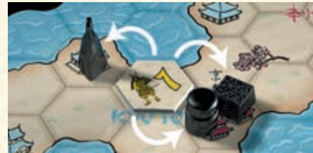
Der Helm, der Buddha und das Reisfeld werden mit Stärke 1 beeinflusst.

Jedes Plättchen beeinflusst alle benachbarten Figuren, die es beeinflussen kann: