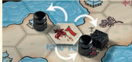
Alle 3 Figuren werden vom Reiter beeinflusst.