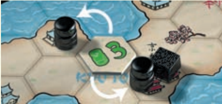
Die beiden Buddhas werden beeinflusst, das Reisfeld nicht.

Jedes Plättchen beeinflusst alle benachbarten Figuren, die es beeinflussen kann: