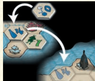
Plättchentausch legen, Plättchen aufnehmen und sofort neu legen.

Von allen 20 Plättchen tragen 5 ein japanisches Schriftzeichen: 侍 Von diesen 5 Plättchen mit Schriftzeichen darf der Spieler beliebig viele pro Zug legen: