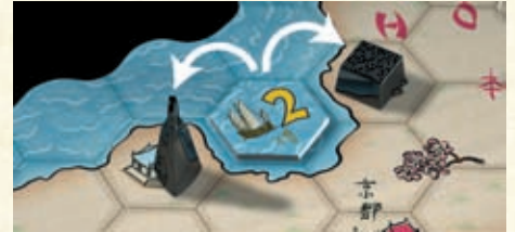
Beide Figuren werden vom Schiff beeinflusst.