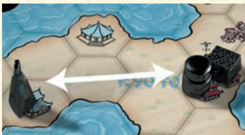
Figurentausch in die Schachtel zurücklegen und 2 Figuren tauschen.

Der Plättchentausch selbst hat die Stärke 0.