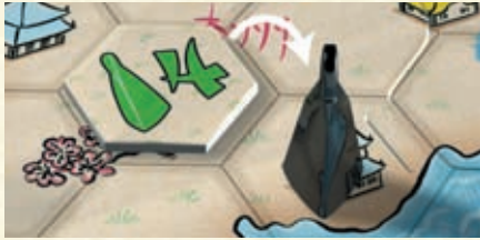
Der Helm wird mit Stärke 4 beeinflusst.

Mit einer Ausnahme tragen alle Plättchen eine Zahl. Diese Zahl gibt die Stärke des Einflusses an: